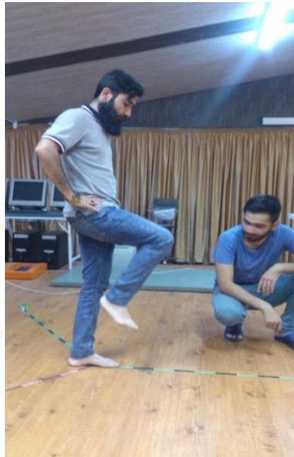
تصویر ۲. آزمون تعادلی Y

در جهت عقربه‌های ساعت انجام شود. برای اجرای این آزمون، آزمودنی روی یک پا در مرکز قرار گرفت و با پای دیگر تا جایی که خطا نکند (پا از مرکز دستگاه حرکت نکند، روی پای که عمل دستیابی را انجام می‌دهد تکیه نکند یا شخص نیفتد) عمل دستیابی را انجام می‌داد و به حالت طبیعی روی هر دو پا برمی‌گشت. فاصله محل تماس تا مرکز فاصله دستیابی است. هر آزمودنی هر کدام از جهات را سه بار به صورت دایره‌ای انجام می‌داد و در نهایت میانگین آنها محاسبه و بر طول اندام تحتانی (از خار خاصره قدامی فوقانی تا قوزک داخلی) بر حسب سانتی متر تقسیم و در ۱۰۰ ضرب شد تا فاصله دستیابی بر حسب اندازه طول پا بدست آید (۲۳). پایایی درون گروهی عالی ( ICC = 0.99/0.88 ) را برای این آزمون گزارش شده است (۲۳).